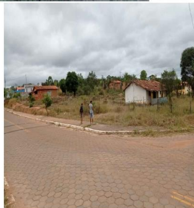
FOTO DO LOCAL