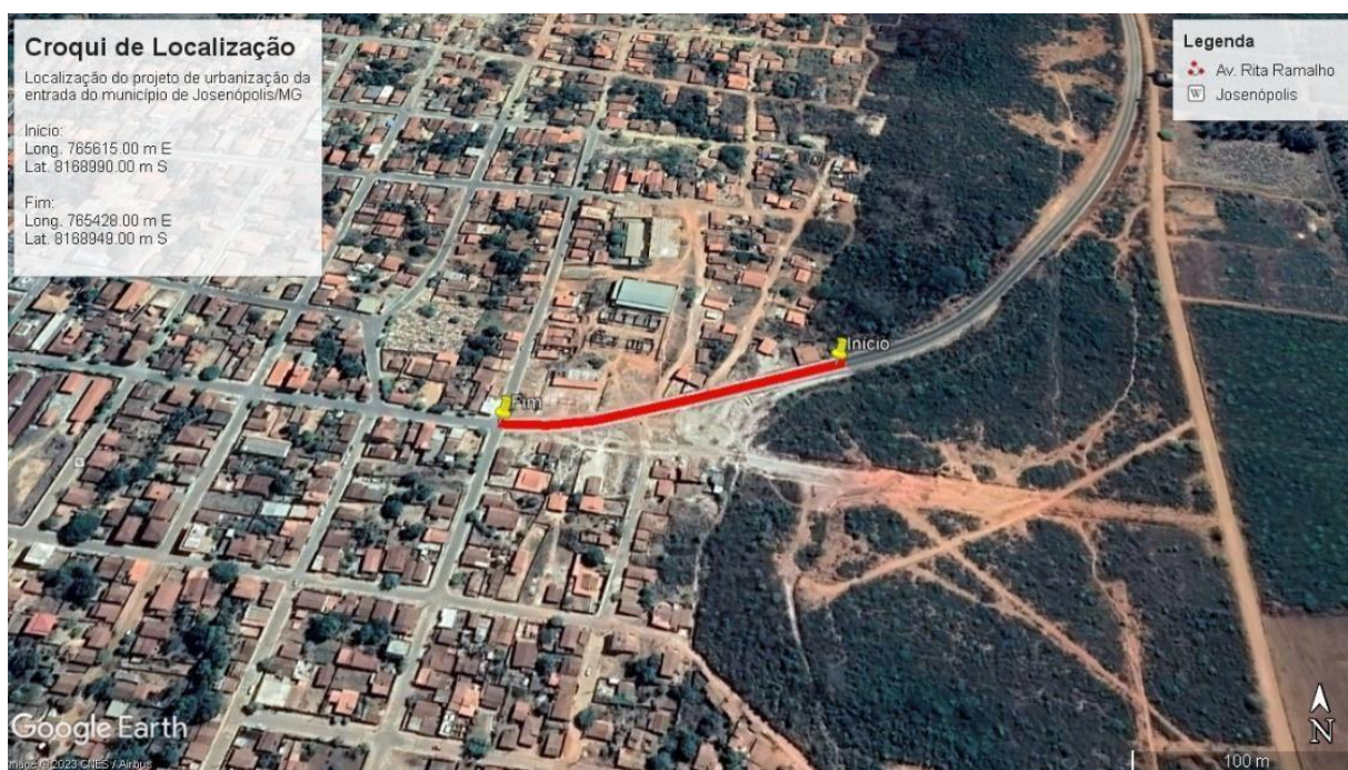
Imagem: Croqui de Localização